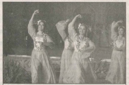
Прекрасный и неповторимый Самарканд - один из древнейших городов мира - встречает участников и гостей Международного музыкального фестиваля «Шарк тароналари»