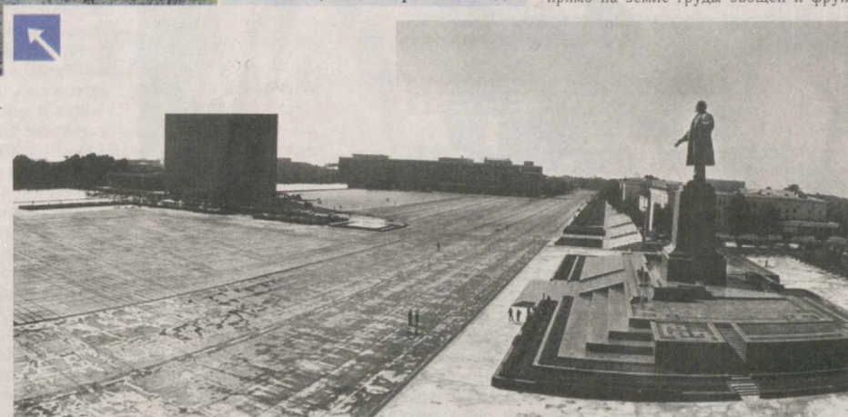
Площадь имени Ленина. 1989 год.

Из выступления И.Каримова на собрании городского актива. г.Ташкент, 20 января 1990 года.