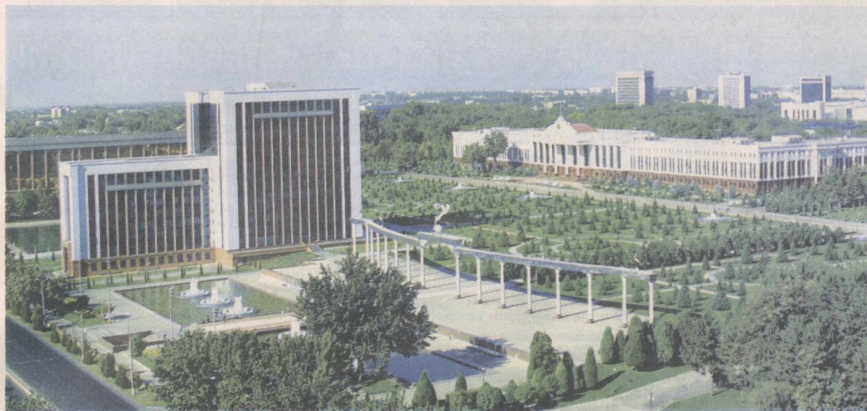
Площадь Мустакиллик. 2011 год.