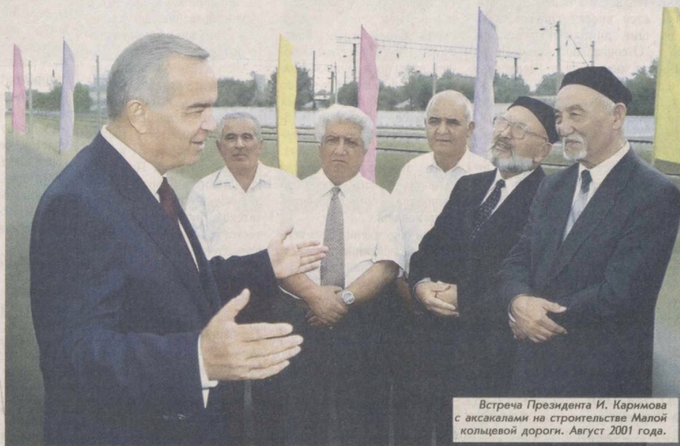
Встреча Президента И. Каримова с аксакалами на строительстве Малой кольцевой дороги. Август 2001 года.

"Мы обязаны... сделать все, чтобы Ташкент стал городом высокой культуры, которым могли бы по праву гордиться не только наши современники, но и наши дети и внуки, как сегодня мы гордимся старым Ташкентом, его историей, культурой, его замечательным прошлым".