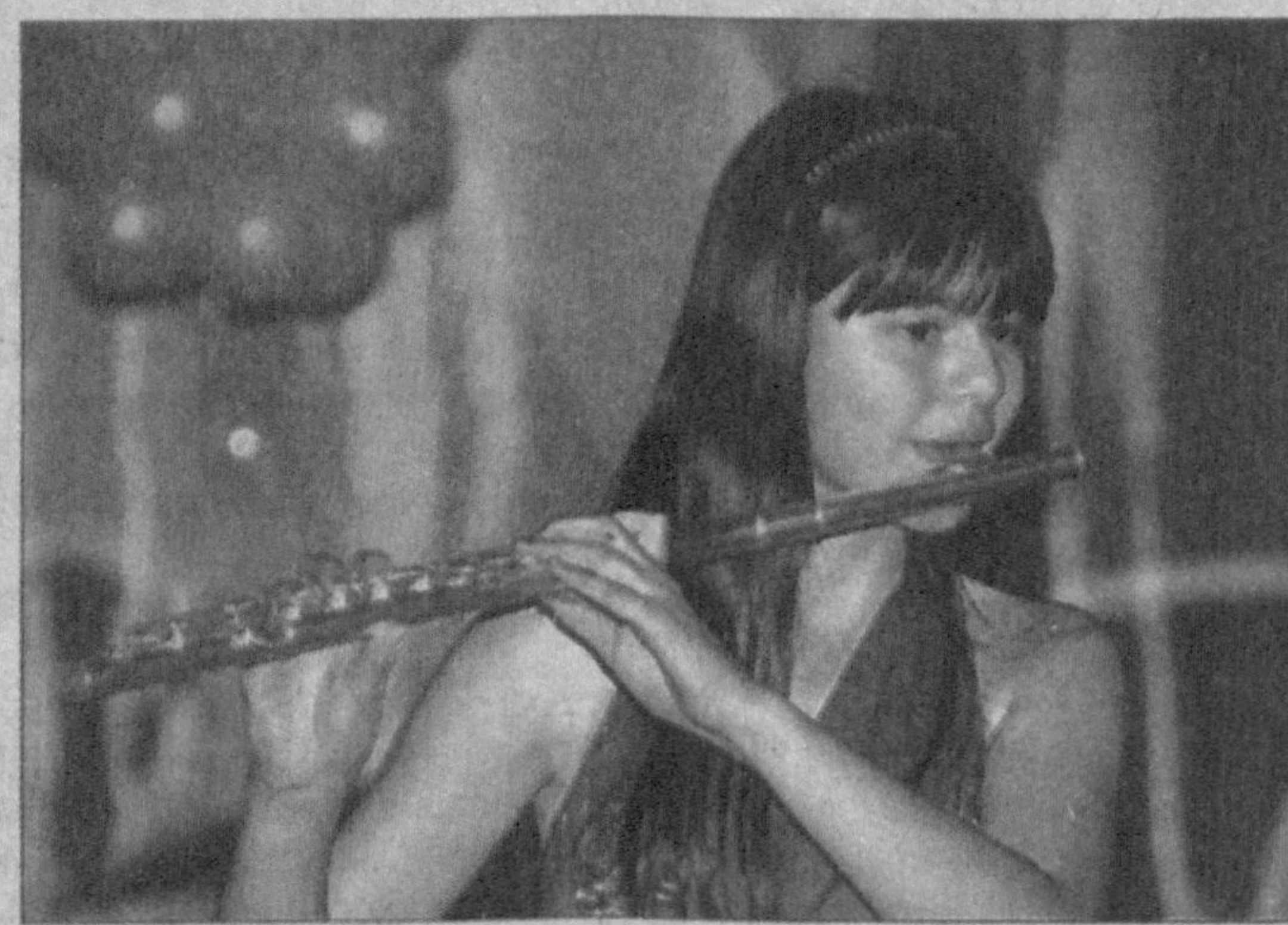
Суратларда: якуний босқичдан лаҳзалар.