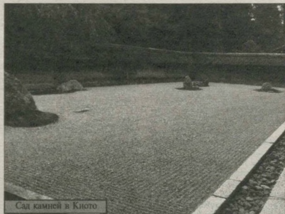
Сад камней в Киото