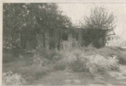
В хозяйстве имени Артыкова, расположенном на значительном расстоянии от районного центра Гульбахор, предприниматели в последнее время расширяют спектр оказания различных услуг населению. Теперь в сельской глубинке можно приобрести любые товары, заказать транспорт, найти репетитора по музыке, школьным предметам, спортивным занятиям. Все бы хорошо, да вот происходит это иногда с нарушением закона.