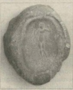
Уже не первый сезон удача сопутствует совместной узбекско-итальянской археологической экспедиции, ведущей раскопки на памятнике древней материальной культуры - Кафир-кала.