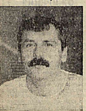
Подполковник Ильдар Абуабакиров