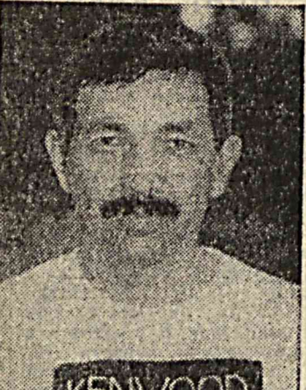
Полковник Шамиль Гареев