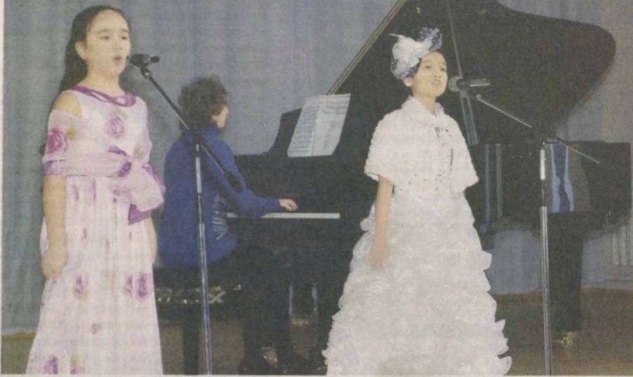
В детской школе музыки и искусства № 4 Мирабадского района прошел городской конкурс на лучшее исполнение патриотической песни.

В мероприятии, прошедшем в преддверии Дня защитников Родины, приняли участие ученики 30 различных школ музыки и искусства. Юные исполнители разных возрастов ответственно готовились к событию, подбирая композиции, которые соответствовали бы не только тематике, но и звучали в унисон с сердцами зрителей.