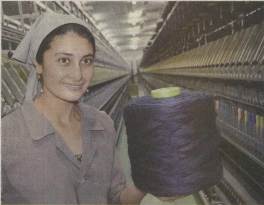
На снимке: работница Мастера Бегматова.