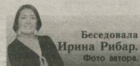
Беседовала Ирина Рибар.