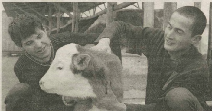
■ Фермерское хозяйство "Тошлок Юсуф Амин", специализирующееся на скотоводстве, является в Ташлакском районе Ферганской области одним из показательных.

Ойбек Ортиков. Соб. корр. "Правды Востока". Наманганская область.