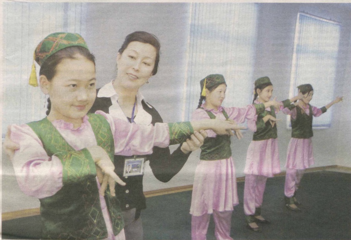
■ В детской школе музыки и искусства №8 Чимбайского района Республики Каракалпакстан обучаются 232 учащихся.

В школе, которая в рамках исполнения постановления Президента Ислама Каримова "О Государственной программе укрепления материально-технической базы и дальнейшего улучшения деятельности детских школ музыки и искусства