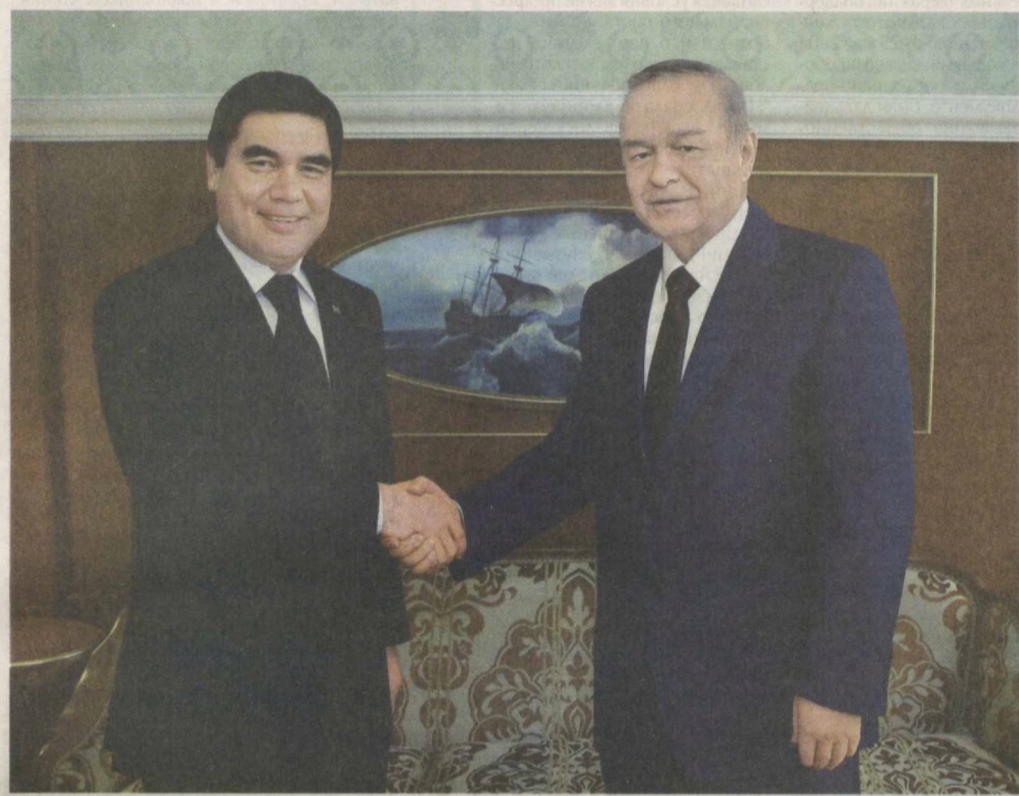
Президент Республики Узбекистан Ислам Каримов 7 февраля принял участие в церемонии открытия XXII зимних Олимпийских игр в городе Сочи.