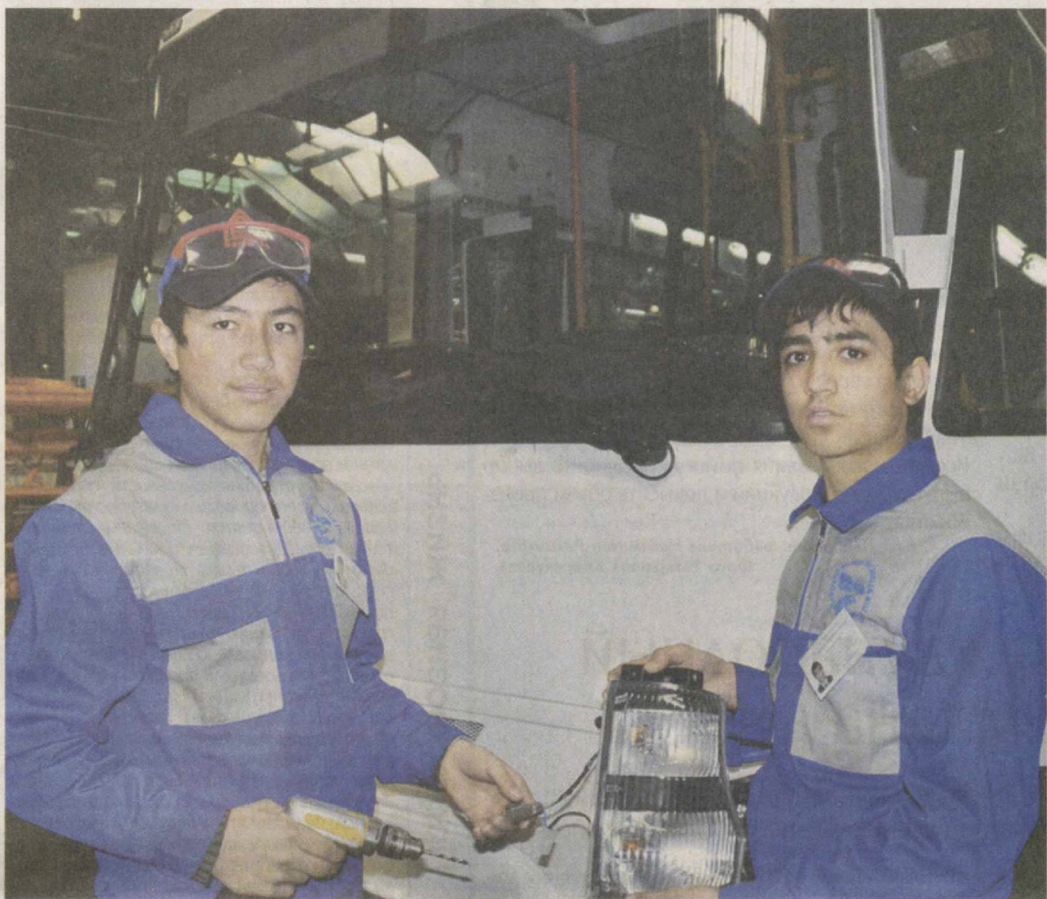
«Озаренная молодежь - будущее страны» - под таким лозунгом в Самарканде в рамках выполнения постановления Президента «О дополнительных мерах по реализации государственной молодежной политики» от 6 февраля 2014 года состоялась презентация свободных рабочих мест по 33-м специальностям.

Она была организована хокимиятом Самаркандской области совместно с областным советом ОДМ «Камолот», а также областными управлениями Центрального банка, по труду и социальной защите населения, среднего специального, профессионального образования, комиссией по делам несовершеннолетних при областном хокимияте.