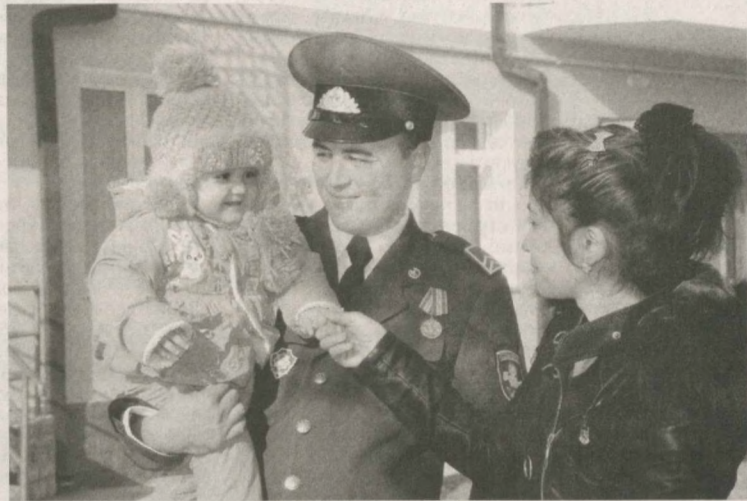
В Ферганской области сданы в эксплуатацию новые дома для группы военнослужащих пограничных войск Службы национальной безопасности Республики Узбекистан.

В организованном в связи с этим мероприятием участие представители государственных и общественных организаций, сотрудники органов правопорядка, активисты махалли.