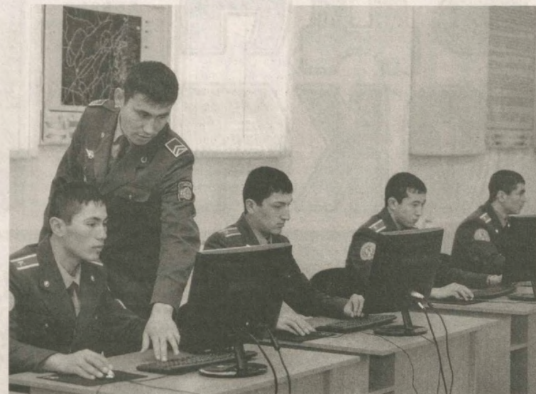
В Ташкентском высшем общевойсковом командном училище состоялось праздничное мероприятие, посвященное Дню защитников Родины.