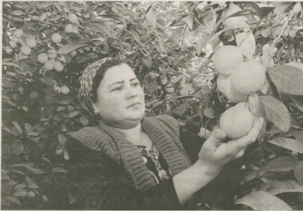
Жители махаллы "Каттакашар" Учкунприкского района Ферганской области эффективно используют свои приусадебные участки, являющиеся важным источником дохода. В эти дни в теплицах созрел богатый урожай.

По словам председателя схода граждан махаллы Абдурашула Набиева, на территории махаллы около одной тысячи теплиц. Ежегодно выращивается более тысячи