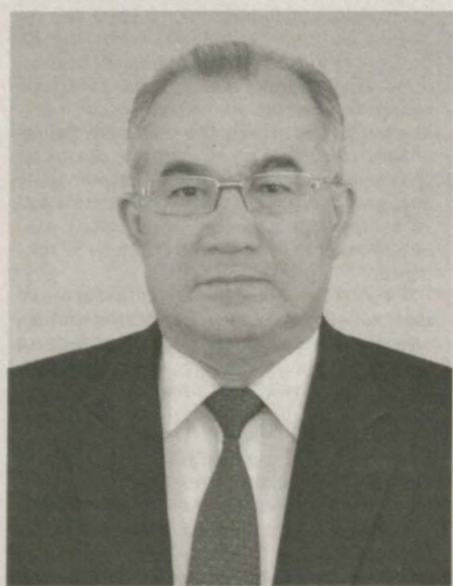
Акмаль Холматович Саидов

Кандидат в Президенты Республики Узбекистан от Демократической партии Узбекистана "Миллий тиклашниш" Акмаль Холматович Саидов родился в 1958 году в Янгиюльском районе Ташкентской области. По национальности - узбек. Образование - высшее, окончил юридический факультет Ташкентского государственного университета. Доктор юридических наук. Член Демократической партии Узбекистана "Миллий тиклашниш".