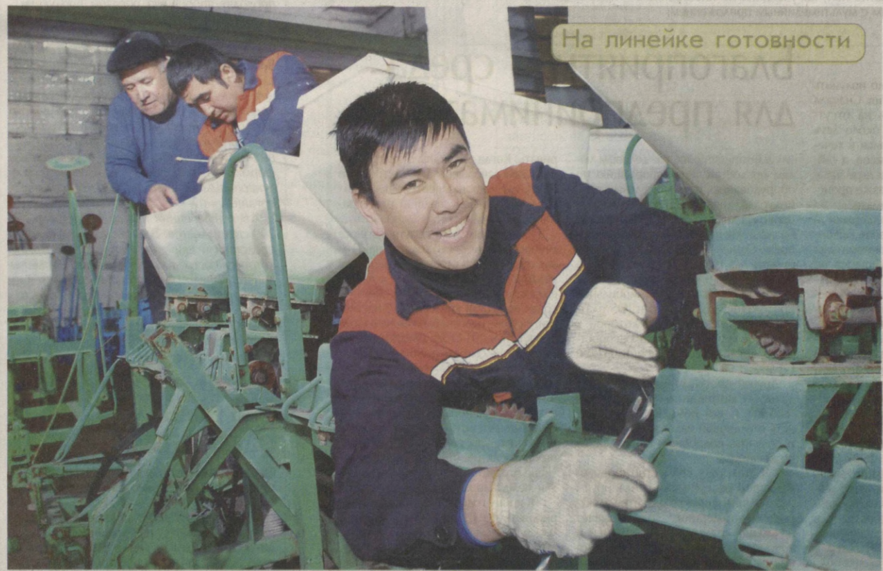
На линейке готовности

До начала активной фазы подготовительных работ к посевной кампании осталось немного. В Куйичирчикском районе Ташкентской области парк сельскохозяйственной техники к старту уже готов.