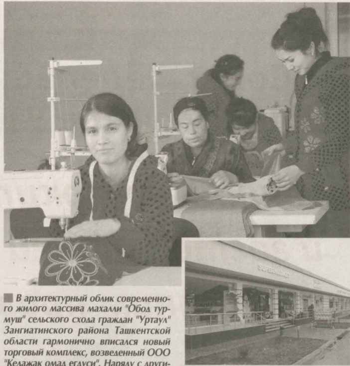
В архитектурный облик современного жилого массива махаллы "Обод турмуш" сельского схода граждан "Уртаул" Загитатинского района Ташкентской области гармонично вписался новый торговый комплекс, возведенный ООО "Келажак омад егауси". Наряду с другими сервисными услугами свои предлагает и открытый здесь швейный цех.

Мастерицы готовы выполнить любой заказ - будь то женское платье, мужской костюм или шторы. В умелых руках швей быстро мелькают иголки с ниткой, другие девушки обсуждают с клиентами