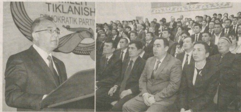
Кандидат в Президенты Республики Узбекистан от Демократической партии Узбекистана "Миллий тикланиш" Акмаль Саидов 20 марта встретился с избирателями Сырдарьинской области.

Во встрече с кандидатом участвовали представители государственных и общественных организаций, работники сходов граждан, учащиеся и преподаватели образовательных учреждений региона, активисты партии, журналисты.