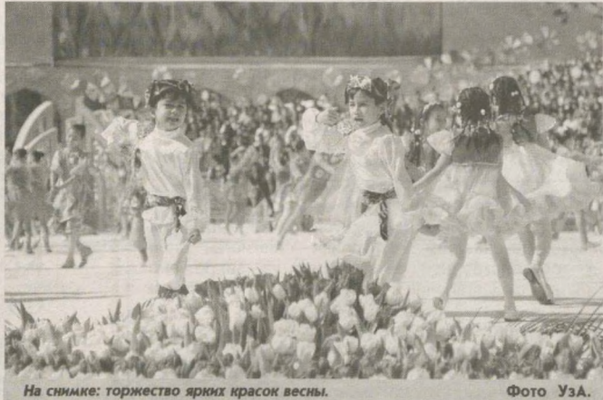
На снимке: торжество ярких красок весны.

В этот день жители села дарят аксакалам и почтенным матерям, отмечающим завершение очередного и начало нового 12-годичных жизненных циклов, па-