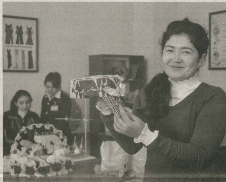
В детском центре "Баркамол авлод" Шахриханского района Анжисканской области 630 учащихся эффективно проводят свободное от уроков время.

Олимжон Сурхон. Сурхандарьинская область.