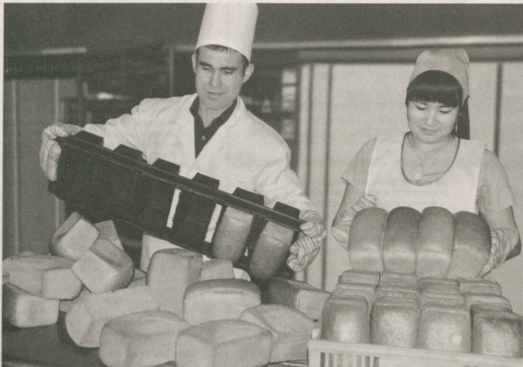
В ООО "Сугаиёна нон" города Навои изготавливают пять видов хлеба и хлебобулочных изделий. На предприятии мощностью 15 тысяч штук формового хлеба работа налажена в две смены.

прошлом году получило более 220 миллионов сумов чистой прибыли. Часть продукции, выпускаемой в действующих в городах Навои и Зарафшане цехах "Сугаиёна нон", поставляют соответствующим предприятиям и социальным учреждениям.