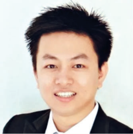
Минг ЧЕНГ, Мерзебург амалий фанлар университети ҳузуридаги давлат коллегияси директори, профессор (Германия):

Халқаро экспертлар Остона саммити якунларини шарҳлар экан, Ўзбекистон ШХТ доирасидаги ҳамкорликни фаоллаштириш ва чуқурлаштириш ташаббусларидан бири бўлиб қолаётганини, шунингдек, минтақада барқарорлик ва хавфсизликни мустаҳкамлашда муҳим ўрин тутаётганини таъкидламоқда.