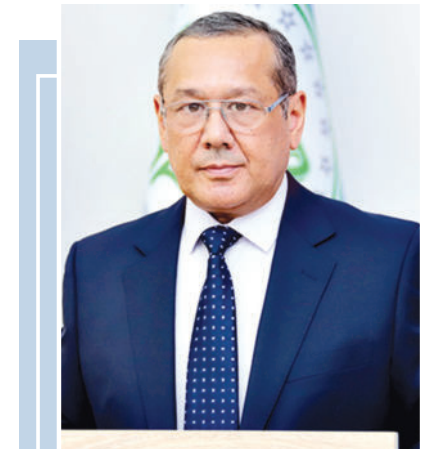
Улугбек ИНОЯТОВ, Олий Мажлис Қонунчилик палатаси фракция раҳбари

Ҳар қандай мамлакатнинг дунё ҳамжамиятидаги ўрни ва аҳамияти унга ташрифларда яққол кўринади. Июль ҳам мамлакатимиз учун олий даражадаги ҳамкорлик ташрифи билан бошланди. БМТ Бош котибининг юртимизга келиши, давлатимиз раҳбари билан самарали учрашув ўтказгани кўп томонлама аҳамиятли жараёндир.