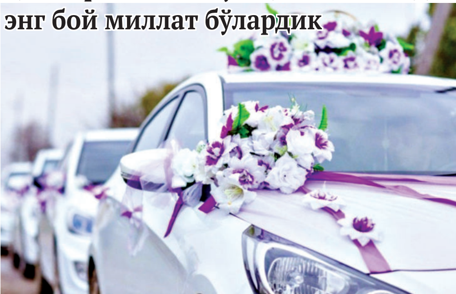
этилган, тўкин дастурхонда меҳмон бўлган, тўйдаги хатти-ҳаракатларни кузатган Бахтияр Лоро бундай фикрга келган ва уни оммавий ахборот воситасида ёритишимизни илтимос қилган эди: “Агар ўзбеклар бу қадар тўкиб-сочиб, исрофгарчилик билан тўй қилмаганида эди, дунёдаги энг бой миллат бўлардик”.

ёхуд ортиқча харажатсиз тўй қилганимизда энг бой миллат бўлардик