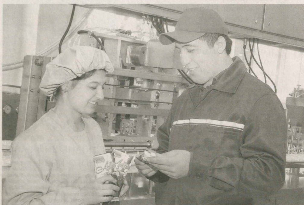
В Термезе по заказу учредителей общества с ограниченной ответственностью "Саиджон Мухаммаджон музаймоклари" построено предприятие по переработке молока.

На возведение заводских корпусов и оснащение цехов современным технологическим оборудованием затрачено шесть миллиардов сумов. Здесь в основном будет производиться мороженое. Доставку сладкой продукции в торговую сеть и точки общественного питания берут на себя сами производители. Предприятие обеспечило работой 80 горожан, две трети из них - выпускники профессиональных колледжей.