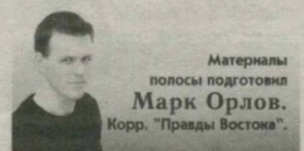
Материалы подготовил Марк Орлов. Корр. "Правды Востока".

Над всеми этими инструментами продвижения собственной продукции или услуг необходимо тщательно и непрерывно работать. Только тогда они обеспечат представителю малого бизнеса многократный и постепенный либо резкий рост продаж.