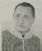
Материалы полосы подготовил Тимур Низаев. Обозреватель "Правды Востока".