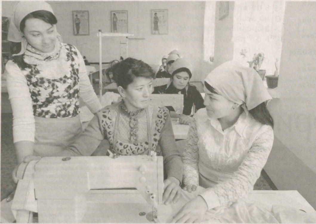
В Ферганской области уделяется особое внимание трудоустройству выпускников профессиональных колледжей.

В нынешнем учебном году областные профессиональные колледжи окончат 57800 человек.