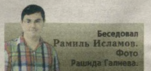
Беседовал Рамиль Исламов.

Мне самой даже сейчас не со всеми удается найти общий язык. Бывают разные ситуации, дети и огрызнуться могут, но обычно вскоре прощаем друг друга. За время работы выпустила пять классов, и нынешний замечательный - дети воспитанные и любознательные, сразу два отличника и 17 хорошистов. Многие ученики даже спустя годы, встретив на улице, помнят, как меня зовут, рады видеть, навешают и в школе, и дома. Как это приятно! Да, профессия сложная, нервная, но где легко? Где будет такая отдача? Это очень хорошая работа, и я с радостью иду сюда каждое утро. Всем коллегам желаю того же.