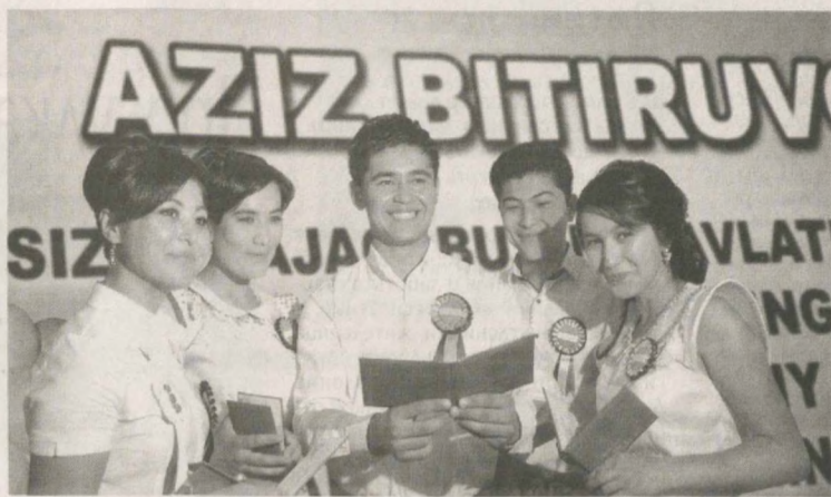
В эти дни во всех 122 профессиональных колледжах и шести академических лицеях области проходят проводы выпускников, на которых юношам и девушкам вручают дипломы об окончании учебного заведения.

Торжественные мероприятия, организованные хокимиятом Ташкентской области, областными управлениями среднего специального профессионального образования, труда и социальной защиты населения, советом ОДМ "Камолот", стали для более чем 37 тысяч выпускников, прошедших обучение по 106 специальностям, определенным подведением итогов. Теперь для них начинается новый этап в жизни. Поздравить ребят и пожелать им успехов в труде и карьерном росте пришли представители махалинских сходов граждан, общественных организаций, руководители предприятий всех форм собственности.