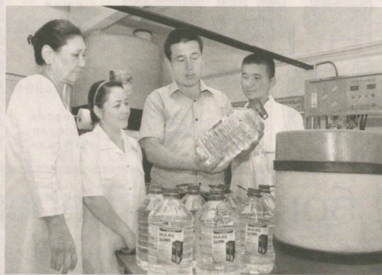
Общество с ограниченной ответственностью «Табий ичимликлар» города Нукуса наладило производство бутилированной питьевой воды, чая и кваса.

Недавно предприятие ввело в строй новый цех, в котором при финансовом содей-