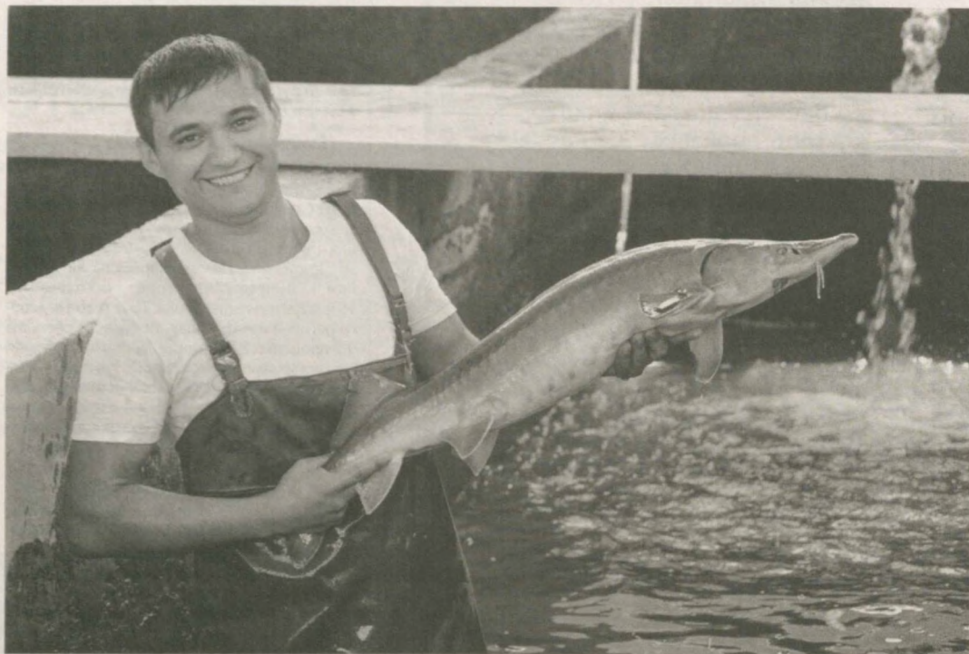
На научно-опытной станции развития рыбоводства при Министерстве сельского и водного хозяйства Узбекистана организован показательный семинар, посвященный преимуществам интенсивного метода в рыбоводстве.

Этот метод в нашей стране эффективно применяется для дальнейшего развития рыбоводческой отрасли и бесперебойного обеспечения населения рыбой продукции. Важным фактором этого служит постановление Кабинета Министров "О мерах по углублению демонополизации и приватизации в рыбной отрасли" от 13 августа 2003 года.