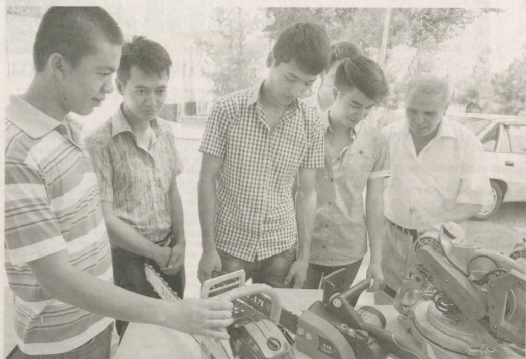
В колледжах и лицеях республики проходят "Дни открытых дверей для начала своего бизнеса".

В инициативу Министерства труда и социальной защиты населения вовлечены коммерческие банки, городские и районные хокимияты, налоговые органы, махалинские комитеты, подразделения Комитета женщин и Торгово-промышленной палаты.