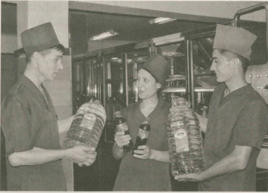
■ Частное предприятие "AFRI" в Ургенчском районе Хорезмской области - одно из тех, кто завоевал прочное место на внутреннем рынке. Здесь с использованием современных технологий налажен выпуск бутылированной питьевой воды и нескольких видов прохладительных напитков. На предприятии, начавшем деятель-

ность в 2002 году, сегодня трудится более 110 человек. Предприятие также производит крышки для пластмассовой тары и ПЭТ-капсулы. На снимке: на частном предприятии "AFRI". Хорезмская область.