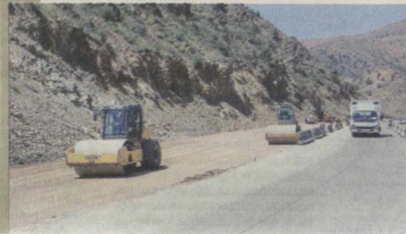
На снимке: дорожный строитель Гафур Омонов.

От сильного государства - к сильному гражданскому обществу