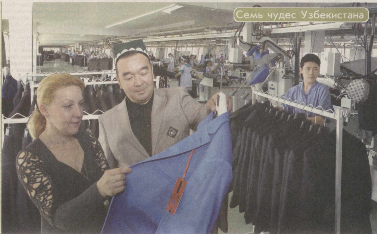
Семь чудес Узбекистана

Четвертый материал из цикла под рубрикой "Семь чудес Узбекистана" читайте на 2-3-й стр.