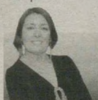
Беседовала Ирина Рибар.

Отрадно, что благодаря личной поддержке нашего Президента, безбрежное как океан творческое наследие Навои сегодня изучается учеными нашей страны и во всем мире, издаются серии научных трудов, монографии и брошюры. Имя поэта носят Национальный парк, в котором прохоят самые главные праздники, и Национальная библиотека Узбекистана, город, театр оперы и балета, проспекты и станция метро, Государственный музей литературы Академии наук и Самаркандский государственный университет. Отечественными и зарубежными учеными-навоиведами собрано столько уникальных исторических документов и рукописей, выполнено столько исследований, написано монографий, что вполне хватило бы на целый музей. Моя мечта увидеть "Хамсу", созданную нашими современниками, в XXI веке.