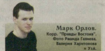
Марк Орлов. Корр. "Правды Востока".

По инициативе главы государства была разработана Программа мер по улучшению мелиоративного состояния орошаемых земель на 2001-2005 годы и на период до 2010 года. Поскольку конечной стадией этого процесса не может быть в принципе (циклическая на одной территории составляет, как правило, пять лет),