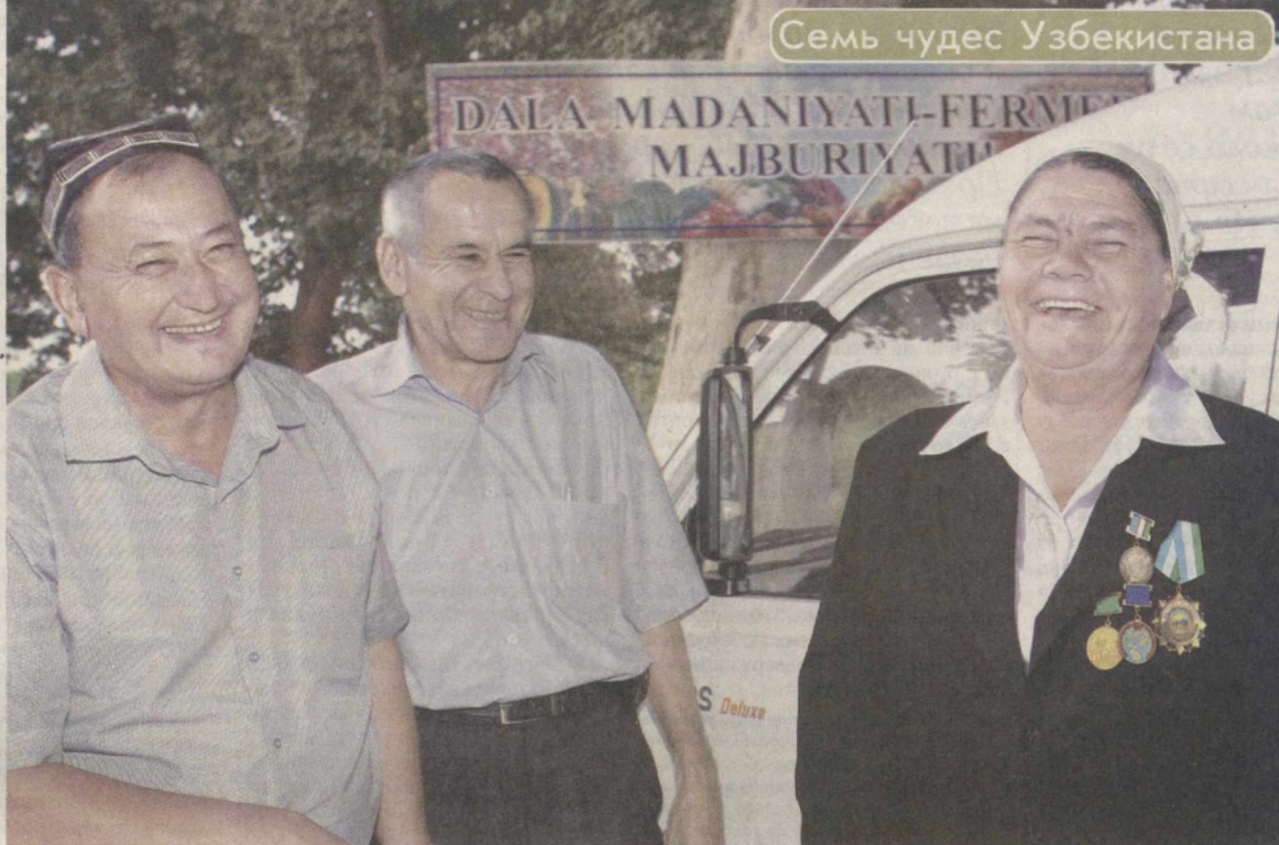
Семь чудес Узбекистана

Мне довелось побывать во многих фермерских, дехканских и личных подсобных хозяйствах в разных регионах республики, пообщаться с большим количеством сельхозпроизводителей. И знаете, что, на мой взгляд, как ничто другое наиболее отчетливо обозначает перспективы отечественного агропрома? То, что после всего увиденного и услышанного меня и практически всех, на кого по возвращении в город обрушиваю повествование очевидца, долгое время не покидает мысль: "А неплохо было бы тоже заняться, скажем, разведением птицы или садоводством!" Зачем? Да потому, что это прибыльно, это гарантированный спрос и не требуется сумасшедших вложений в начале пути. А уж во что потом превратится нажитый капитал, научно-технический прогресс покажет.