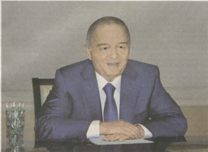
Президент Республики Узбекистан Ислам Каримов 22 сентября в резиденции Оксарой принял президента Экспортно-импортного банка (Эксимбанк) Республики Корея Ли Дук Хуна.

Приветствуя гостя, глава нашего государства отметил всестороннее и динамичное развитие отношений между нашими странами. Государственный визит Ислама Каримова в Республику Корея в мае текущего года - первый зарубежный визит после прошедших выборов Президента Узбекистана, подчеркнул масштаб и перспективы расширения многогранного взаимовыгодного сотрудничества.