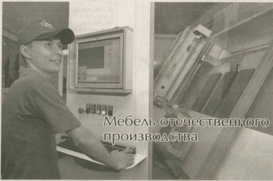
Мебель отечественного производства

Постановление главы нашего государства "О дополнительных мерах по поддержке экспорта субъектов малого бизнеса и частного предпринимательства" от 8 августа 2013 года служит важным фактором расширения объемов производства продукции субъектами малого бизнеса, созданию благоприятной деловой среды.