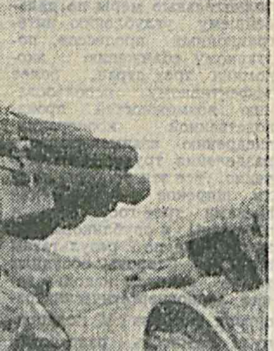
ристам предстоит в сжатые сроки провести полное обслуживание своей грозной техники; подготовить ее к новому этапу боевой учебы.