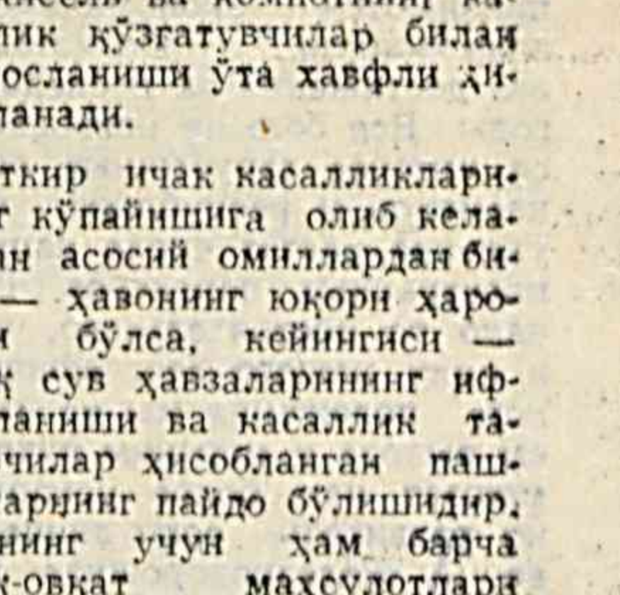
Уткир ичак касалликларидан сақланинг