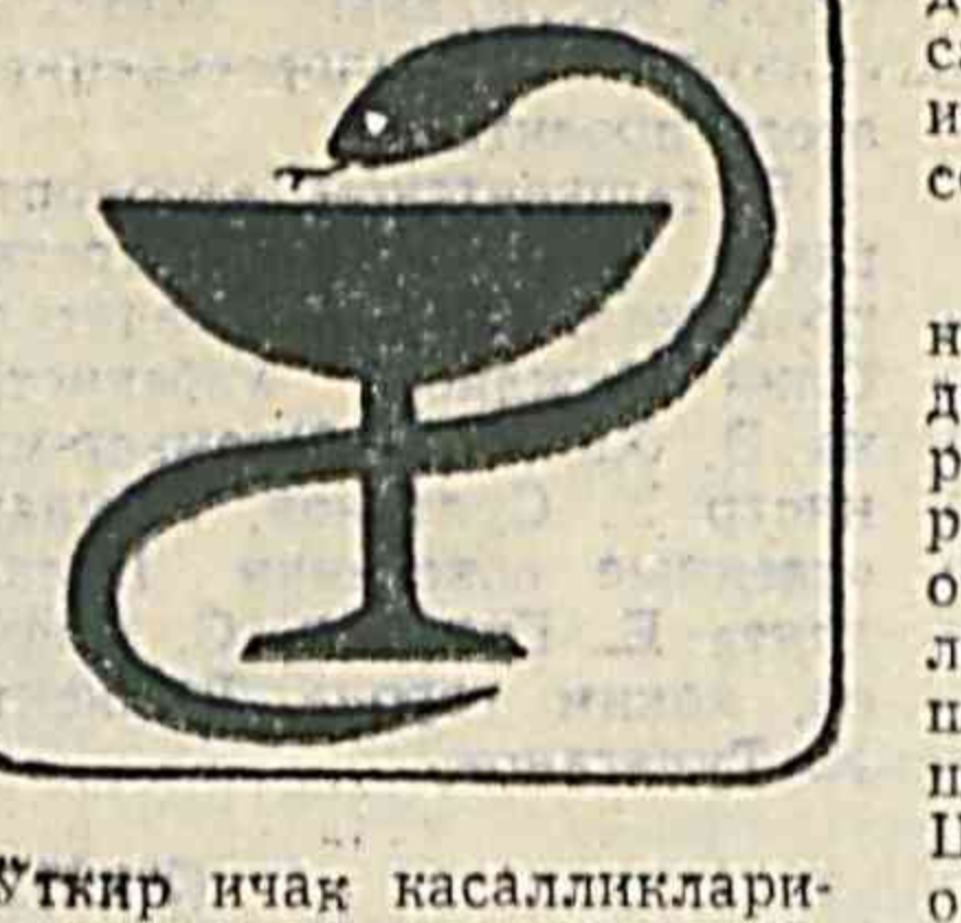
Уткир ичак касалликларидан сақланинг