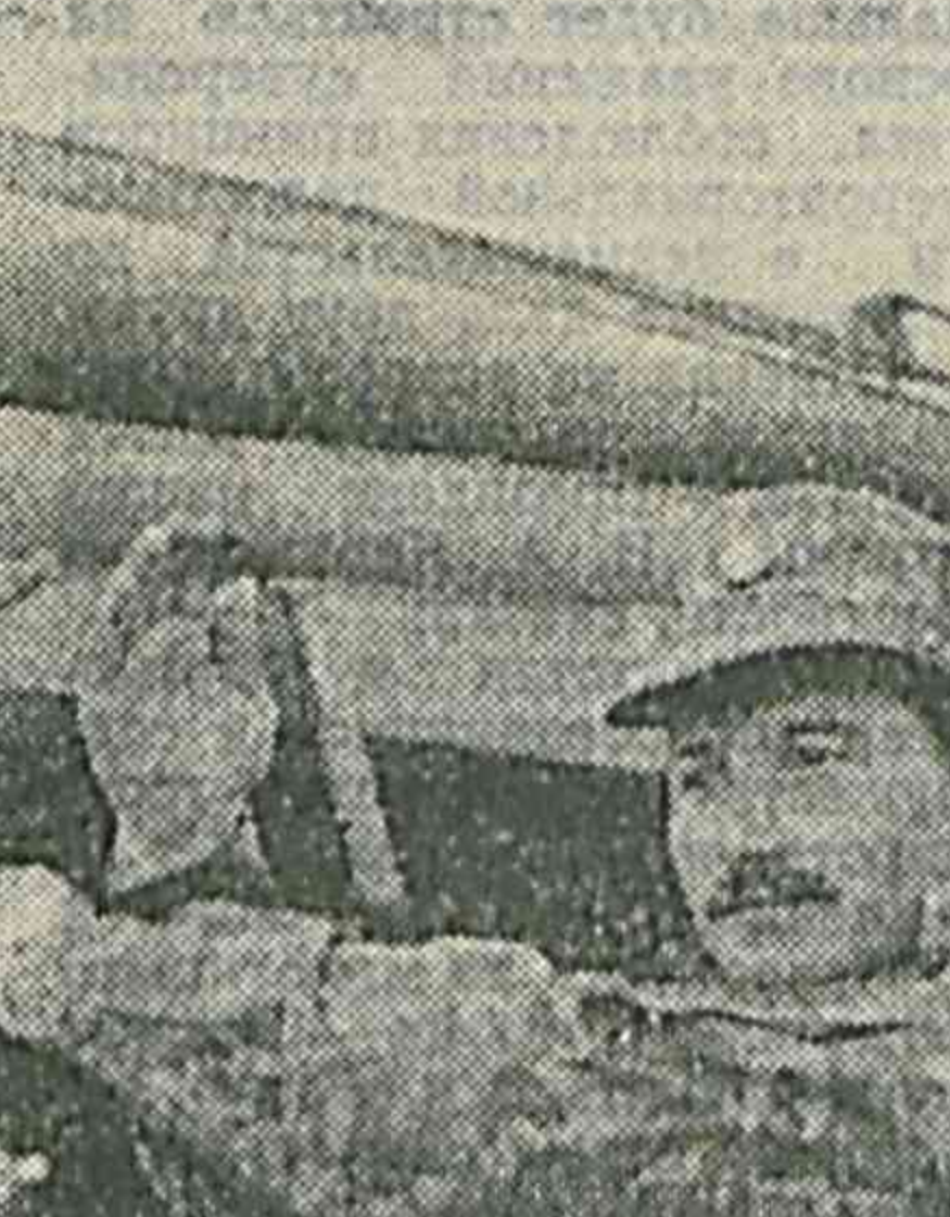
ристам предстоит в сжатые сроки провести полное обслуживание своей грозной техники; подготовить ее к новому этапу боевой учебы.

В числе лучших по итогам работ неоднократно отме-