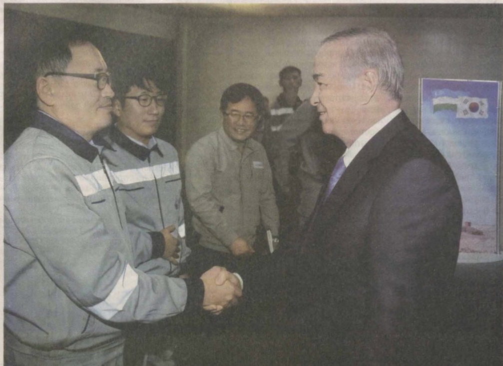
Президент Республики Узбекистан Ислам Каримов в целях ознакомления с ходом строительства Устыртского газохимического комплекса 25 апреля побывал в Республике Каракалпакстан.

Экономический потенциал нашей страны динамично и неуклонно наращивается. Под руководством Президента Ислама Каримова осуществляется широкомасштабная работа по модернизации и диверсификации экономики, совершенствованию современной инфраструктуры бизнеса. Благодаря макроэкономической стабильности и благоприятному инвестиционному климату в Узбекистане самые развитые государства, авторитетные международные финансовые институты активно сотрудничают с нашей страной. В результате постоянно увеличивается число новых современных предприятий, в том числе и совместных.