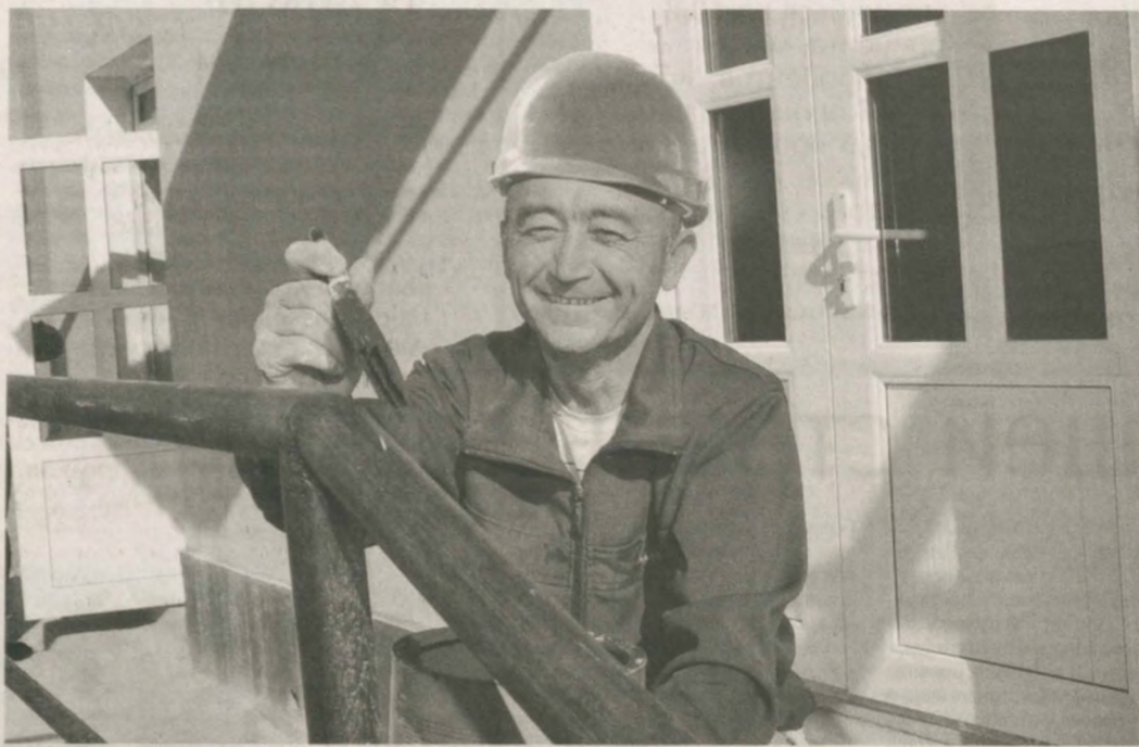
■ Особое место в системе осуществляемых в стране реформ занимает улучшение жизни сельского населения. Год от года облик населенных пунктов меняется в лучшую сторону, семьи получают новые комфортабельные дома.

В прошлом году на 353 массива построено 10 тысяч таких домов жилой площадью свыше 1,5 миллиона квадратных метров. Это на 17 процентов больше, чем в 2012 году. Подрядчики, занимающиеся строительством жилья, а главное, старающиеся локализовать этот процесс, имеют отдельную нишу в ряду своих коллег. Строительная фирма