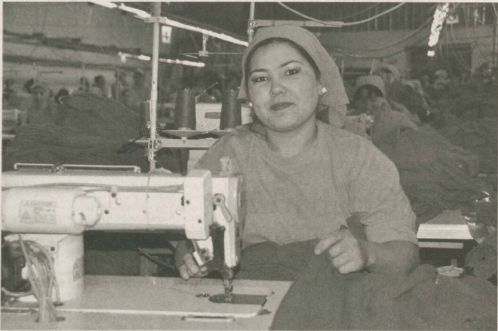
■ Совместное узбекско-англо-российское предприятие "Амин инвест интернэшнл" в Джамбайском районе считается одним из успешных в Самаркандской области.

Специализируется на выпуске 30 видов готовых изделий из хлопчатобумажного полотна. Высокое качество обеспечивается за счет применения добротного сырья и современного оборудования. Продукцию реализует не только на внутреннем, но и внешнем рынках. Сегодня Объединенные Арабские Эмираты, Россия, Украина, Казахстан являются основными покупателями. В 2013 году объем экспорта составил 2740 тысяч долларов.