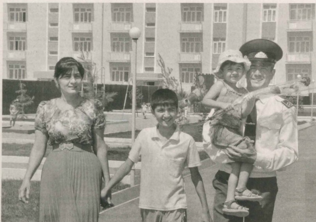
Группе военнослужащих Восточного военного округа вручены ключи от новых домов.