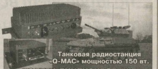
Танковая радиостанция «Q-MAC» мощностью 150 Вт. УСЛУГИ ЛИЦЕНЗИРОВАНЫ, оборудование сертифицировано.

Адрес: 100100, г.Ташкент, ул. Ш. Руставели, д. 60, кв. 1. Тел./факс: (99871) 253-02-76, 253-31-76. E-mail: kvant@tps.uz