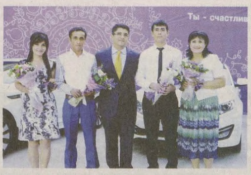
правом говорит "Я - счастливчик!", потому что сделал правильный выбор.

- Благодарна честности розыгрышей призов компании Ucell. Я даже не ожидала, что выиграю главный приз. Яркие акции Ucell, которыми компания не перестает удивлять все эти годы, становятся незабываемым событием в жизни абонентов Ucell, поэтому каждый из нас с полным