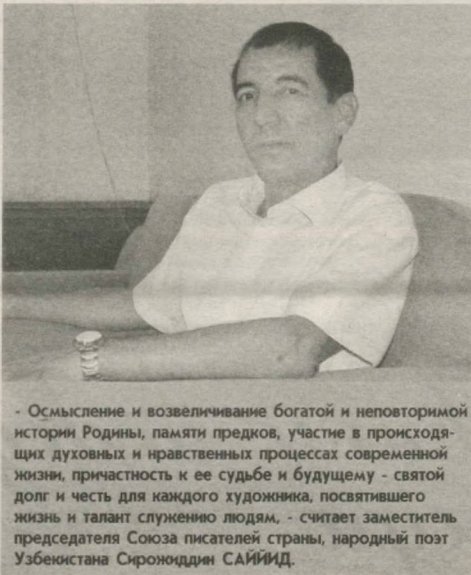
- Осмысление и возвеличение богатой и неповторимой истории Родины, памяти предков, участие в происходящих духовных и нравственных процессах современной жизни, причастность к ее судьбе и будущему - святой долг и честь для каждого художника, посвятившего жизнь и талант служению людям, - считает заместитель председателя Союза писателей страны, народный поэт Узбекистана Сирожддин САИИД.