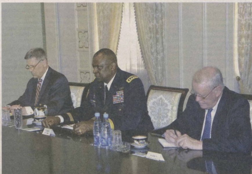
Президент Республики Узбекистан Ислам Каримов 30 июля в резиденции Оксарой принял командующего Центральным командованием Вооруженных Сил США Ллойда Остина, находящегося в нашей стране с визитом.

В ходе состоявшейся беседы были обсуждены актуальные вопросы двустороннего сотрудничества в различных сферах, отдельные проблемы регио-