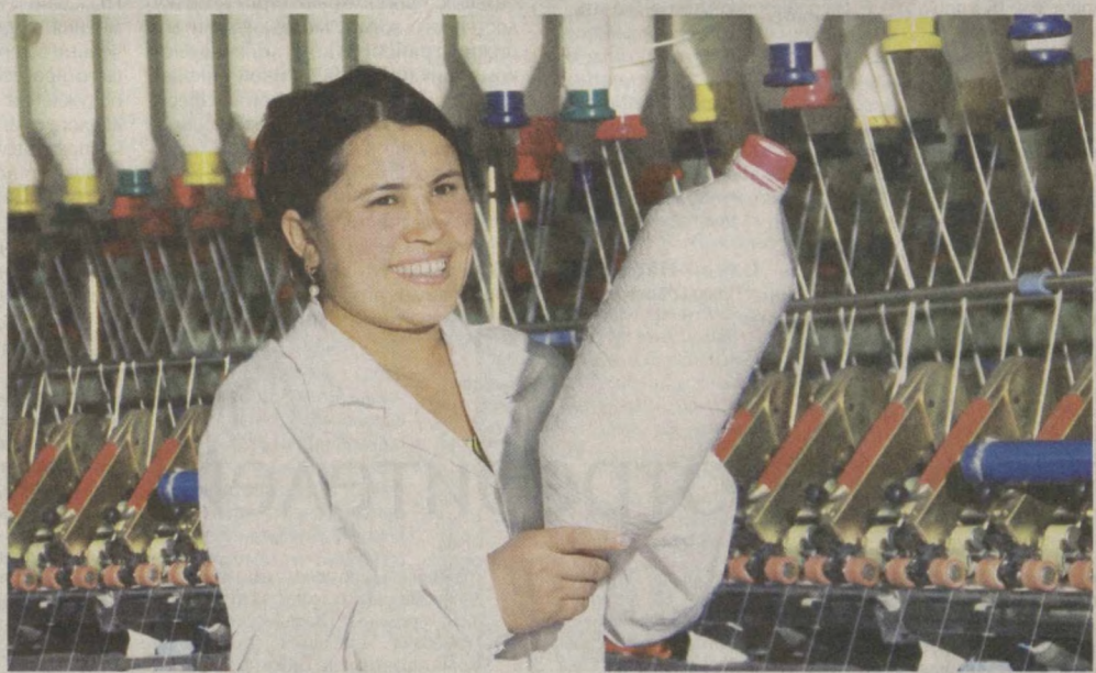
Пряжа - лишь второй продукт после хлопкового волокна в цепочке переработки хлопка-сырца. Продавать ее - все равно что продавать сырье. Замечания по этому поводу Президента нашей страны Шавката Мирзиёева справедливы. Как отметил глава государства на расширенном заседании Кабинета Министров, посвященном итогам социального экономического развития страны в 2016 году и важнейшим приоритетным направлениям экономической программы на 2017-й, в структуре экспорта высоким остается удельный вес пряжи - 53 процента.

Сегодня большинство ее производителей увлеклись экспортом. Но есть и такие предприятия, которые укрепляют баланс между поставкой на внешний и внутренний рынок. Среди них - ИП ООО "RusO'zbekteks".