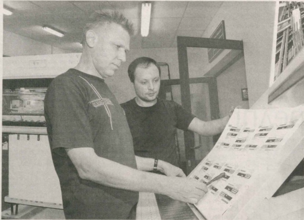
■ В 2012 году оснащение новым оборудованием немецкой компании "Heidelberg" - ведущего мирового поставщика полиграфической техники позволило ООО "Jurabek Print" из Кибрайского района столичной области стать одним из самых современных полиграфических предприятий Узбекистана. Главное направление - производство упаковочных материалов для фармацевтической промышленности. Наладжен контроль качества на всех производственных этапах. На предпри-

ятии работает квалифицированный и энергичный коллектив. Поддержку молодым оказывают старшие коллеги. Внедрение новых технологий, современного менеджмента и обучение персонала позволяют обеспечивать клиентов высококачественной упаковочной, этикеточной и другой полиграфической продукцией.