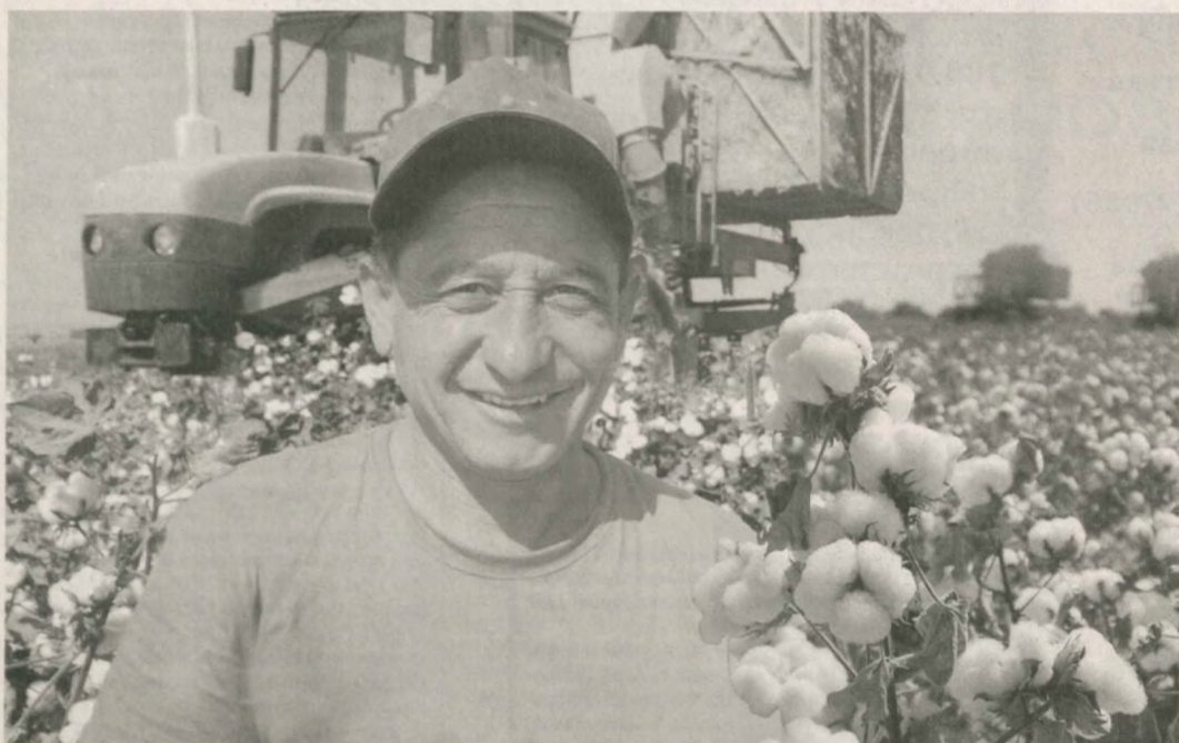
В этом году фермеры Сырдарьинской области, как и все хлопководы республики, наметили собрать большой хирман "белого золота".

Для этого с ранней весны приступили к агротехническим мероприятиям. Интенсивный уход за хлопчатником продолжался все лето, и вот к осени радующий глаза результат - белые от богатого урожая поля. На каждом кустике - до двадцати пяти, а нередко и более тридцати раскрытых коробочек. Теперь нужно собрать урожай в короткие сроки, чтобы ни грамма поистине ценнейшего сырья не осталось на поле.