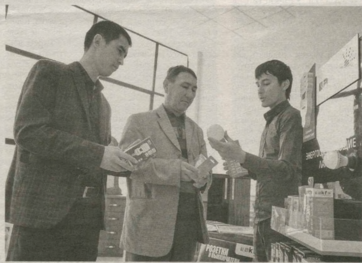
В Нукусе проведен семинар, посвященный вопросам обеспечения исполнения законов и постановлений в сфере развития малого бизнеса и частного предпринимательства, защиты их прав и интересов, предоставления им льгот и преференций.

На мероприятии с участием руководителей правоохранительных органов, министерств, ведомств, филиалов коммерческих банков, заместителей хокимов городов и районов, представителей субъектов малого бизнеса и работников средств массовой информации была представлена выставка продукции субъектов бизнеса.