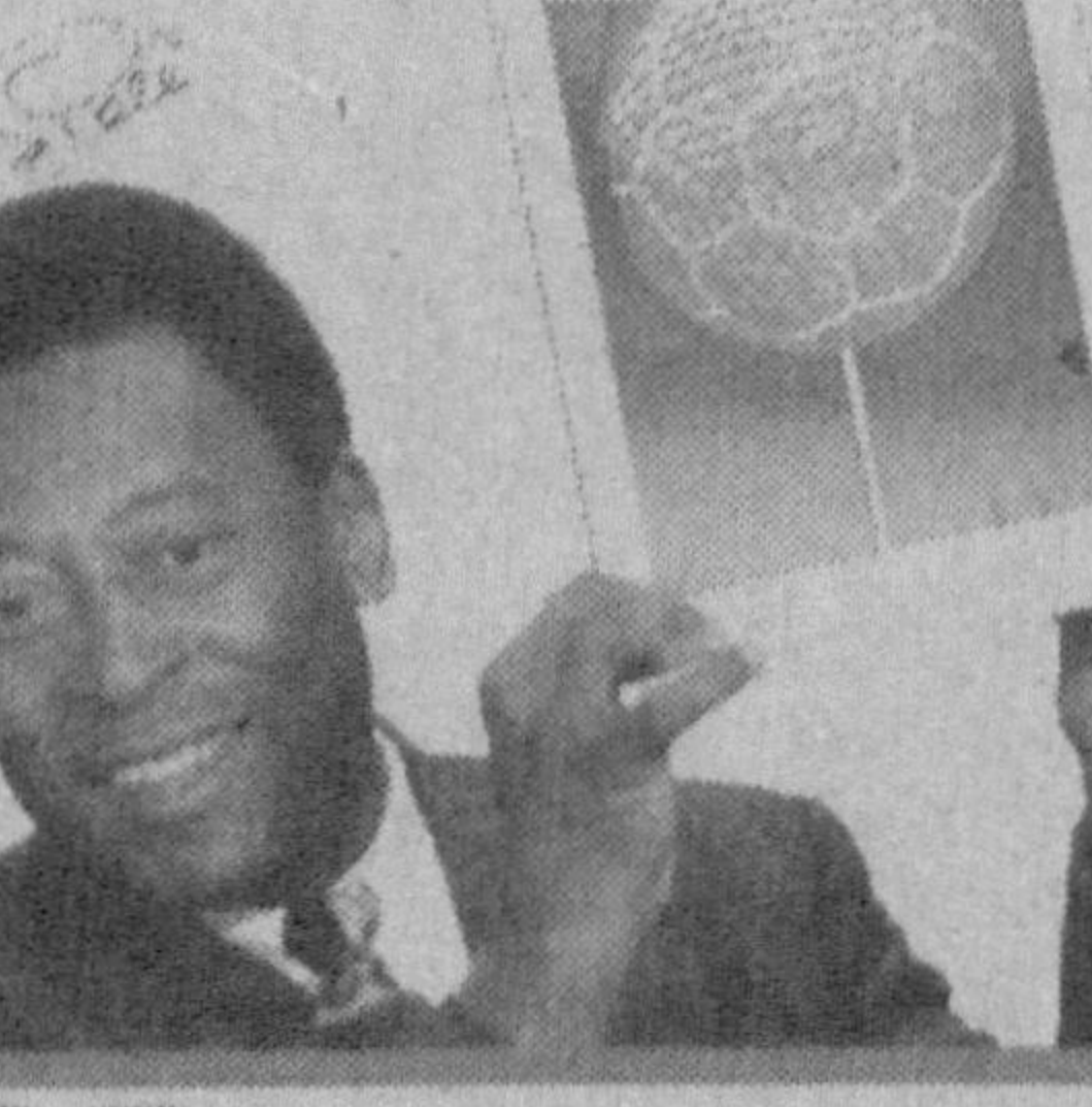
PELE - the king of football

Бекорга айтишмайди-да, иктидорли одам ҳар нарсасида ҳам иктидорлидир. У аjoyиб мусиқа яратар ва уни дўстла-