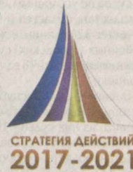
СТРАТЕГИЯ ДЕЙСТВИЙ 2017-2021

Что могут дать ИКТ обществу? Прежде всего среду, в которой взаимодействие с государством удобно и доступно, максимально учтены потребности и нужды жителей. На развитие событий в этом русле направлена отраслевая программа Министерства по развитию информационных технологий и коммуникаций по реализации Стратегии действий в Год диалога с народом и интересов человека. В ней предусмотрены разработка организационно-правовых основ дальнейшего развития сферы, совершенствование системы "Электронное правительство", ИКТ-инфраструктуры, создание дополнительных удобств предпринимателям, меры по обеспечению информационной безопасности.