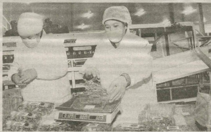
■ Расположенное в столице ООО "GDF Export" специализируется на производстве свежей, замороженной и сушеной плодовоовощной продукции.

Предприятие, имеющее поля и теплицы в Наманганской, Сурхандарьинской и Ташкентской областях, работает по законченному циклу. Здесь выращивают, перерабатывают и отправляют потребителям страны и за рубежом фрукты, овощи, зелень.